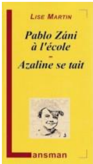
Pablo Zani - Azaline se tait Editions Lansman 2010