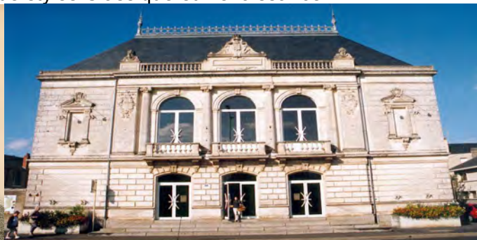
Le théâtre aujourd'hui

La salle est utilisée pendant la première Guerre Mondiale (1914-1918) par les services de l'aviation et sert d'infirmerie.